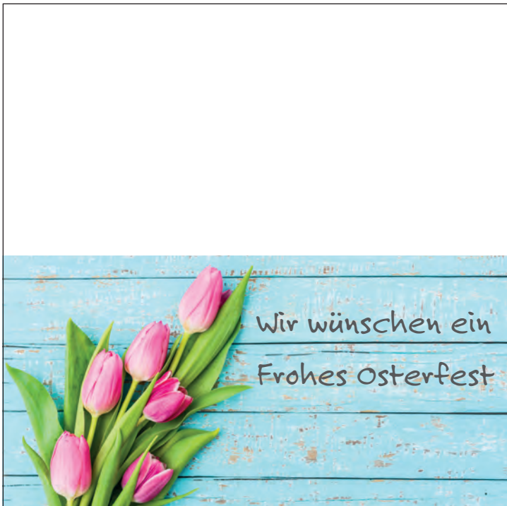
Anzeige-Nr. 3: 2-spaltig x 95mm