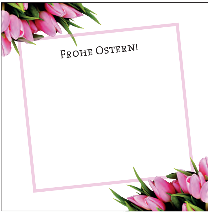
Anzeige-Nr. 1: 2-spaltig x 95mm