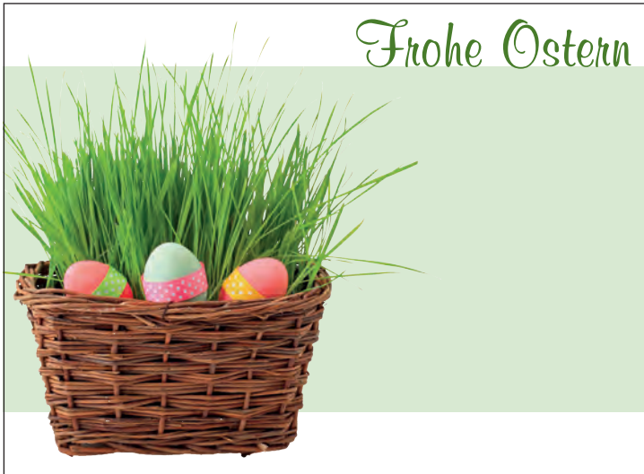
Anzeige-Nr. 2: 2-spaltig x 70mm